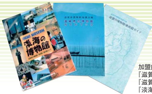
加盟館を紹介した出版物（右より） 『滋賀の博物館・美術館ガイド』 『滋賀県の博物館ガイドブック』 『淡海の博物館』