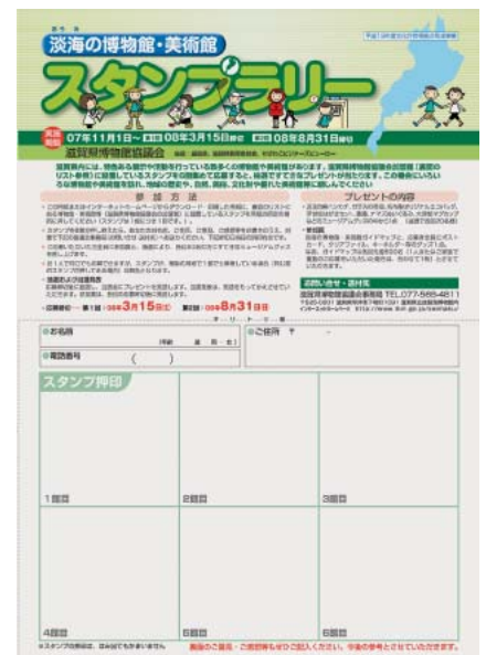
「淡海の博物館・美術館スタンプラリー」応募用紙。加盟館にて配布中

スタンプラリーは2007(平成19)年11月から始まり、2008(平成20)年8月まで開催する予定です。