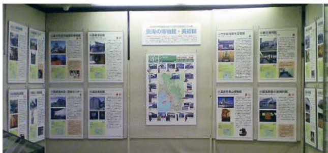
巡回パネル展 （写真は、高月町立観音の里歴 史民俗資料館での湖北エリア 19館の展示）

そして、滋賀県博物館協議会の活 動は、この体力差を埋める役割を果 しています。実際、加盟館の半数程 度について、協議会が各館の活動を 紹介するページが、その館に関する 最も詳細で鮮度の高い電子広報にな っているのです。20周年の記念事業 として行ったスタンプラリーも、各 館単独では実現不可能なアピールが