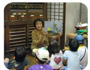
トンボの紙芝居、おもしろかったね~♪