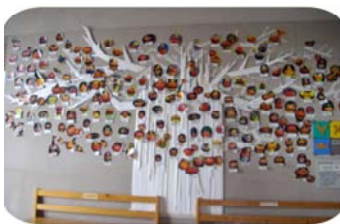
カボチャの作品を展示室の表の壁に、飾っています。ぜひ見に来てください☆